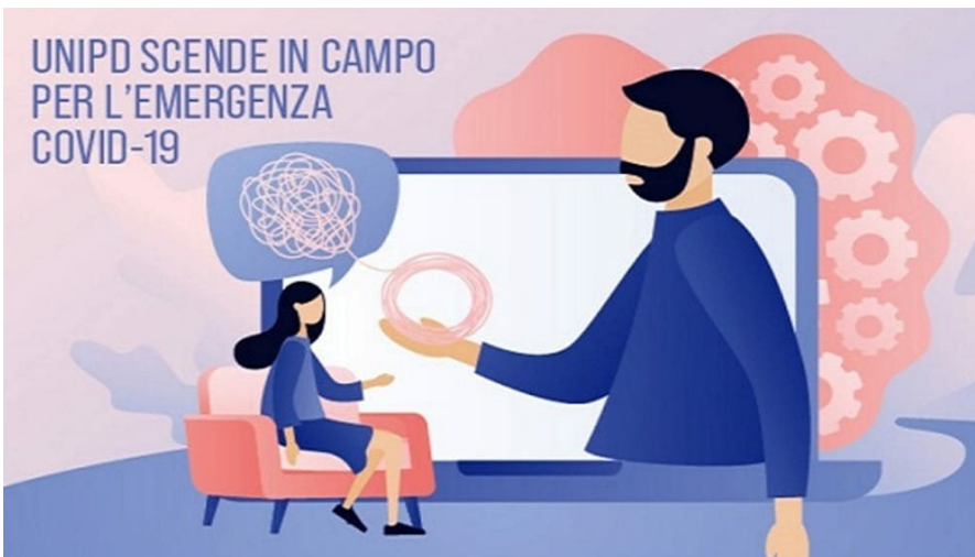
La locandina del progetto

P arlare è possibile: parte da questa considerazione il progetto pilota di attivare un punto di ascolto psicologico online sull'emergenza Covid 19. L'iniziativa è istituita dalla Scuole di specializzazione universitarie di area psicologica (Suap) del Dipartimento di Psicologia dello Sviluppo e della Socializzazione (Dpss) e del Dipartimento di Psicologia Generale (Dpg) in accordo con la Scuola di Psicologia dell'Università di Padova.